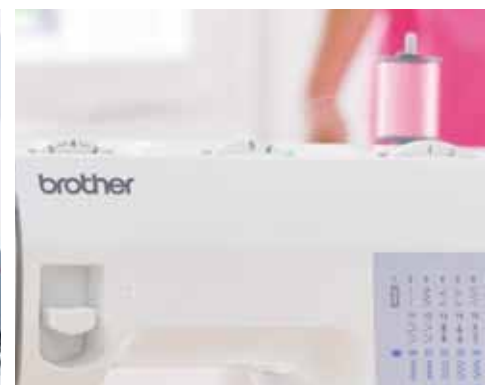
Stichlänge + Stichbreite einstellbar

Weitere Informationen erhalten Sie bei Ihrem Fachhändler oder unter www.brothersewing.eu .