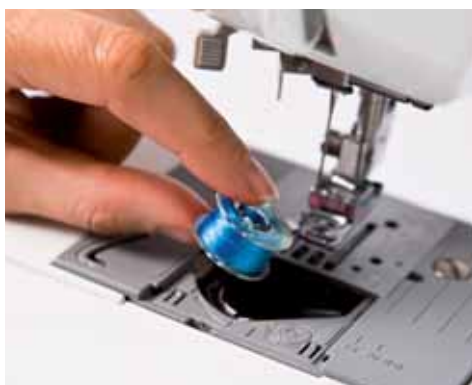
Einfach eine volle Spule einsetzen, schon sind Sie startbereit